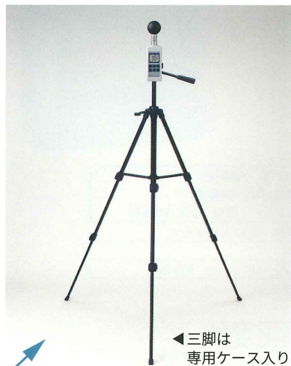
三脚は専用ケース入り

黒球温度の正確な測定には一定の高さが必要です。連続測定するためにも三脚のご使用をお勧めします。