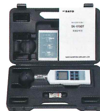
本体はハードケース入り (収納、保管用)

熱中症暑さ指数計 SK-170GT ・9V電池×1個 ・約(W)71×(H)275×(D)30mm ・黒球部φ60mm ・約250g (電池含む)