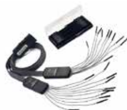
*T3DSO2000HD-MS には MSO オプションが標準装備